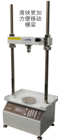
图1GDSL50集水盘和移动横梁