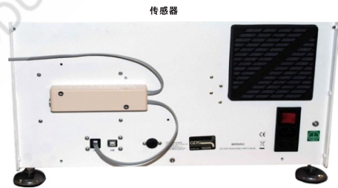
图 2DigiRFM通过CAN接口连接到荷载架的背面